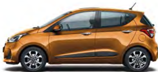
Mandarin Orange (Pearl)