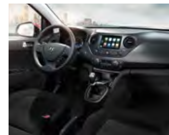
Crni i tamno sivi