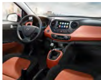
Crni i narandžasti