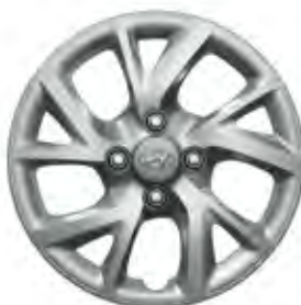
14" dizajnirani naplatak sa 5 dvostrukih krakova (metalik sivi)