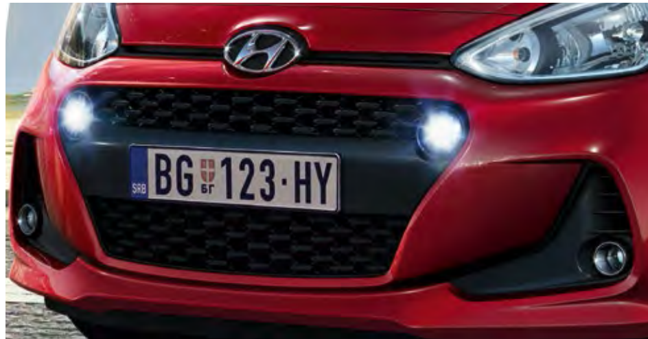
Kaskadna rešetka hladnjaka. Izražajan oblik nove kaskadne rešetke naglašava samopouzdan karakter modela i10.

Osnovni oblik modela i10 u kombinaciji sa novim sportskim linijama privlači pažnju na svakom mestu. Na prednjem braniku potpuno novog oblika je kaskadna rešetka hladnjaka i istaknuta LED dnevna svetla. Novi naplatci, kontrastni umeci zadnjeg branika i redizajnirana zadnja svetlosna grupa dodatno usavršavaju izgled modela i10.