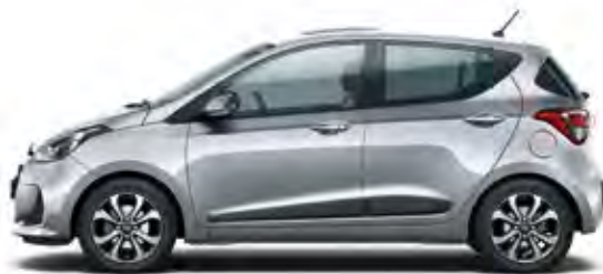
Sleek Silver (Metallic)