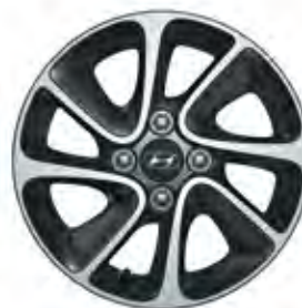
14" dizajnirani alu naplatak sa 8 krakova (metalik sivi)