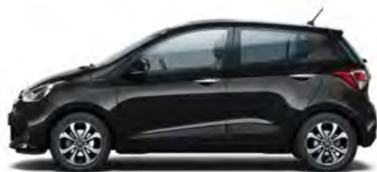
Phantom Black (Pearl)