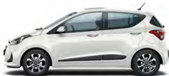
Polar White (Solid)

Kombinujte po vašem izboru boju eksterijera, naplataka i tkanina enterijera da biste sami dizajnirali vaš idealni novi i10.