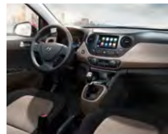
Crni i bež