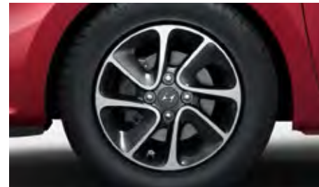
Novi naplatci. Sportski 14" alu naplatci doprinose upečatljivom novom izgledu modela i10 i samo su jedan od četiri dostupna dizajna naplataka.