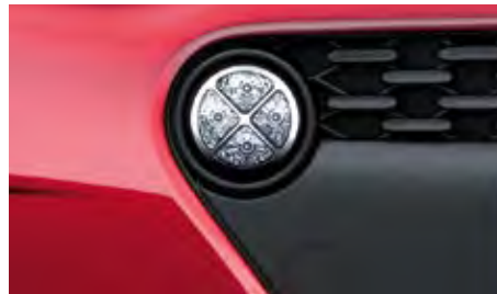
LED dnevna svetla. Nova okrugla LED dnevna svetla naglašavaju sportski izgled prednjeg dela modela i10.