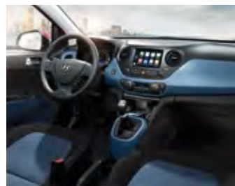
Crni i plavi