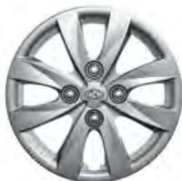
13" dizajnirani naplatak sa 8 krakova (srebrna završnica)