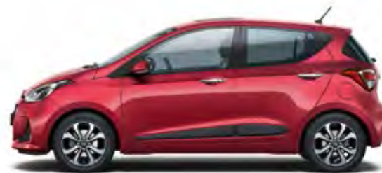
Passion Red (Pearl)