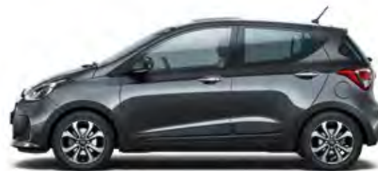
Star Dust (Metallic)