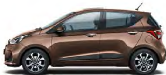
Cashmere Brown (Metallic)