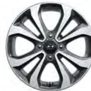
15" dizajnirani alu naplatak sa 4 dvostruka kraka (metalik sivi)