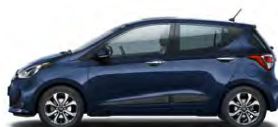
Morning Blue (Solid)