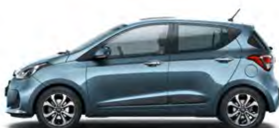
Aqua Sparkling (Metallic)