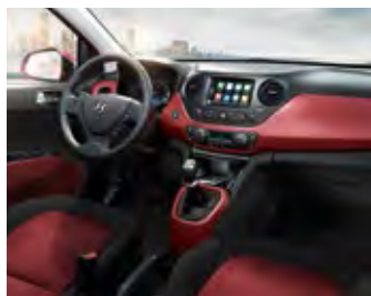
Crni i crveni